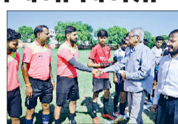
रेवाड़ी। अहीर कॉलेज में खिलाड़ियों से परिचय करते हुए मुख्यातिथि।