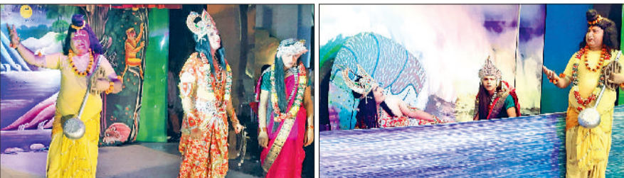
रेवाड़ी। भगवान विष्णु को श्राप देते हुए नारद मुनि तथा भगवान विष्णु से संवाद करते नारद मुनि।