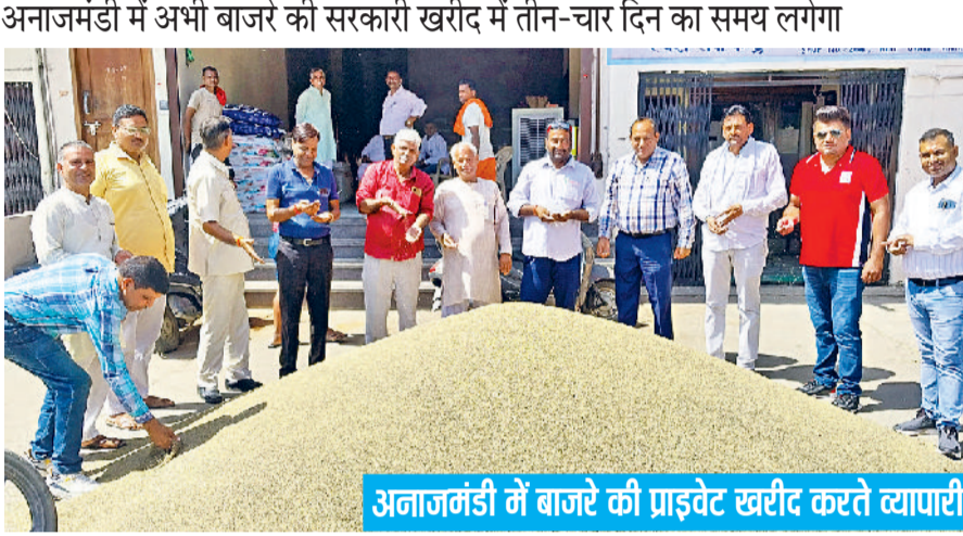
अनाजमंडी में बाजरे की प्राइवेट खरीद करते व्यापारी

मेरी फसल-मेरा ब्योरा पोर्टल पर पंजीकृत किसान ही बाजरे की बिक्री कर सकेंगे। किसानों को ई-खरीद पोर्टल से ही गेटपास लेना होगा, जिन किसानों का जे-फॉर्म कटेगा, उनको ही भावांतर योजना का लाभ दिया जाएगा। इस वर्ष 75 से 80 हजार हेक्टेयर में बाजरा व 8000 हेक्टेयर में कपास बोया गया था। गत वर्ष 2024 में अनाजमंडी में करीब 582402 क्विंटल के करीब बाजरा खरीदा गया था। इसके अलावा 34092 क्विंटल कपास की आवक हुई थी। अनाजमंडी में कपास की आवक शुरू हो चुकी है। कपास का भाव 6000 से 6500 रुपये प्रति क्विंटल चल रहा है।