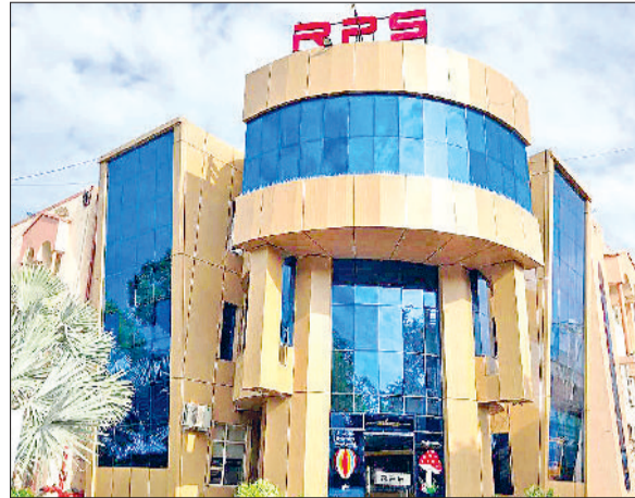
महेंद्रगढ़। आरपीएस विद्यालय।

परीक्षा में भाग लेने वाले विद्यार्थी अपना पंजीकरण कार्यालय परीक्षा में भाग ले सकते हैं। उन्होंने बताया कि परीक्षा देने के लिए आने वाले परीक्षार्थी अपने स्कूल का आई कार्ड व आधार कार्ड भी साथ लेकर आए।