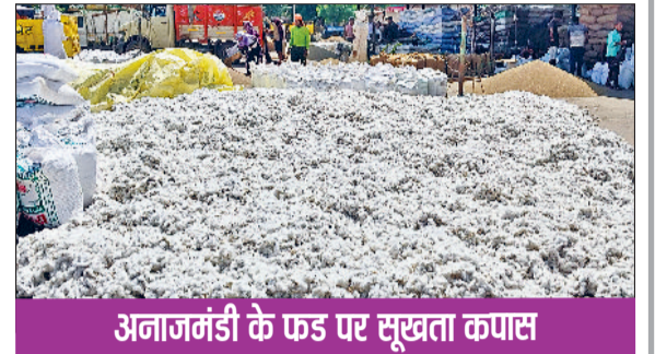
अनाजमंडी के फंड पर सूखता कपास