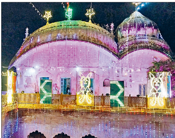
रेवाड़ी। नवरात्र पर रोशनी से जगमग बड़ा तालाब स्थित मंसा माता का मंदिर।