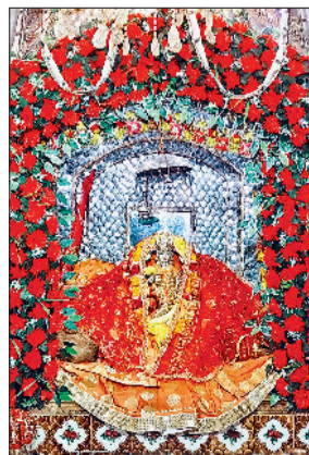
रेवाड़ी। बड़ा तालाब मंदिर में सजी मंसा माता की प्रतिमा।

पूजा के लिए श्रद्धालुओं की भीड़ नजर आ रही है। महिला मंडलों की ओर से भी मंदिरों में भजन-कीर्तन करके मां भगवती की महिमा का गुणगान किया जा रहा है। मंदिरों में प्रातः से देर रात्रि तक श्रद्धालुओं का आवागमन चल रहा है।