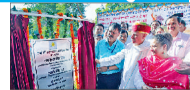
रेवाड़ी। इंड्रप्रस्थ गैस लिमिटेड की पीएनजी का शुभारंभ करते राव इंद्रजीत सिंह।

रेवाड़ी। केंद्रीय सांख्यिकी एवं कार्यक्रम कार्यान्वयन, योजना और संस्कृति राज्य मंत्री राव इंद्रजीत सिंह ने मंगलवार को गांव रामपुरा में इंड्रप्रस्थ गैस लिमिटेड की पीएनजी यानि पाइपड नेचुरल गैस आपूर्ति का शुभारंभ किया गया। इसके इलावा केंद्रीय मंत्री ने विभिन्न स्कोमों से बनी गलियां, ओपन जौम, शहीद राव तुलाराम पार्क के सौंदर्यकरण कार्य व पार्क में हाल का भी उद्घाटन किया। इस मौके पर केंद्रीय मंत्री राव इंद्रजीत सिंह ने कहा कि आईजीएल की यह पहल ग्रामीण क्षेत्रों में स्वच्छ, सुरक्षित और सतत ऊर्जा स्रोत उपलब्ध कराने का दिशा में एक महत्वपूर्ण कदम है। पीएनजी की आपूर्ति से गांव की महिलाओं को खाना पकाने में अधिक सुविधा मिलेगी और पारंपरिक ईंधनों पर निर्भरता कम होगी। उन्होंने कहा कि यह कदम ग्रामीण जीवन में सकारात्मक परिवर्तन लाने का दिशा में आईजीएल की प्रतिबद्धता को दर्शाता है। इस अवसर पर