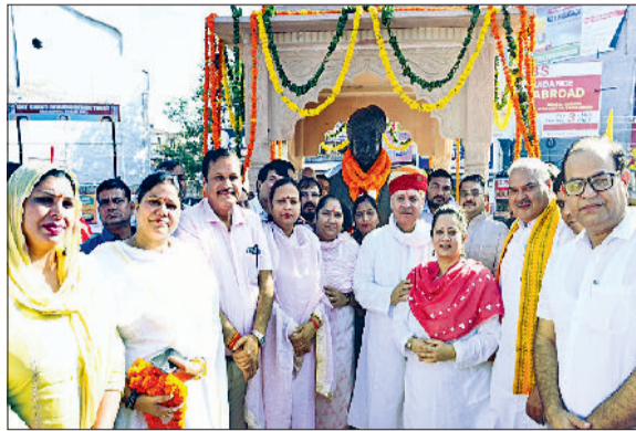
रेवाड़ी। शहीदी दिवस पर अमर शहीद राव तुलाराम को श्रद्धांजलि अर्पित करते हुए मंत्री व विधायक।

हरियाणा वीर एवं शहीदी दिवस के अवसर पर मंगलवार को जिले में अमर शहीदों के स्मारक स्थलों पर महान विभूतियों को नमन किया गया। शहर के शहीद राव तुलाराम चौक व राव तुलाराम पार्क स्थित शहीद स्मारक पार्क में केंद्रीय राज्य मंत्री राव इंद्रजीत सिंह व स्वास्थ्य एवं आयुष्य मंत्री कुमारी आरती सिंह राव ने अन्य जनप्रतिनिधियों के साथ महान स्वतंत्रता सेनानी राव तुलाराम की प्रतिमा पर माल्यार्पण व पुष्पचक्र अर्पित करते हुए श्रद्धांजलि अर्पित की, वहीं गांव रामपुरा में भी अमर शहीदों की शाहदत को सलाम किया गया। इस मौके पर केंद्रीय राज्य मंत्री राव इंद्रजीत सिंह ने कहा कि अमर शहीद राव तुलाराम सरीखे