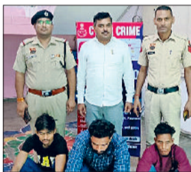
रेवाड़ी। पुलिस गिरफ्तार में साइबर टगी के तीन आरोपी।