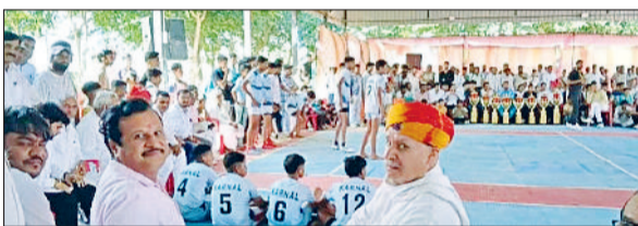
रेवाड़ी। कबड़ी प्रतियोगिता के समापन पर मौजूद राव इंद्रजीत सिंह व अन्य।