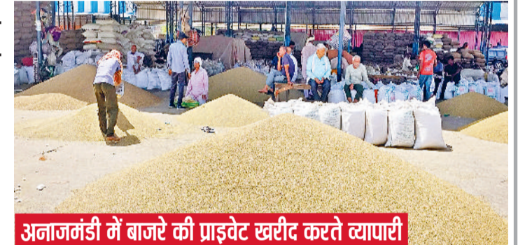
अनाजमंडी में बाजरे की प्राइवेट खरीद करते व्यापारी