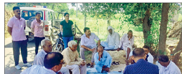
रेवाड़ी। ग्रामीणों को नशे के खिलाफ जागरूक करती पुलिस टीम।

जिला पुलिस सेवा पखवाड़ा के तहत अभियान चलाकर नागरिकों को स्वच्छता, पौधारोपण, रक्तदान, कानून व्यवस्था, अपराध व अपराधियों से दूरी, साइबर क्राइम से बचाव, महिला सुरक्षा, यातायात नियमों व नशा उन्मूलन जैसे महत्वपूर्ण विषयों पर जागरूक कर रही है। मंगलवार को पुलिस की नशा मुक्त टीम ने गांव घुड़कवास, मुंदलिया व डाबड़ी में ग्रामीणों के